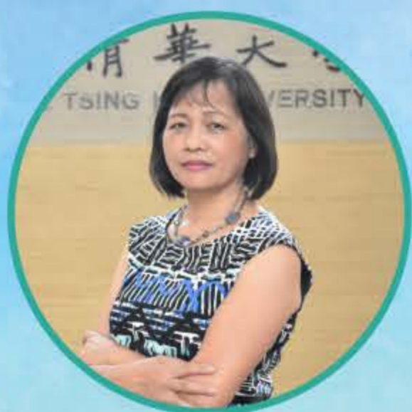
國立清華大學 副教授 呂秀蓮